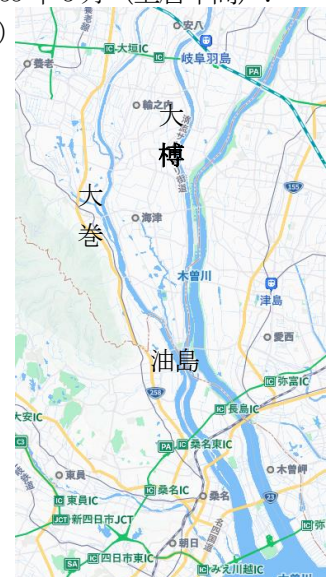
図1 木曾三川位置図→